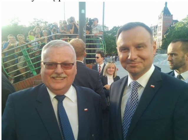
Od lewej: Senator Krystian Probiez, Prezydent Andrzej Duda (zdz. uczestnik spotkania).

Po wystąpieniu prezydent Andrzej Duda przeszedł wśród mieszkańców, można było zrobić dobre zdjęcia pamiątkowe, a ci, którzy blisko stali mogli krótko porozmawiać. Spotkanie zakończyło się przed 20.00.