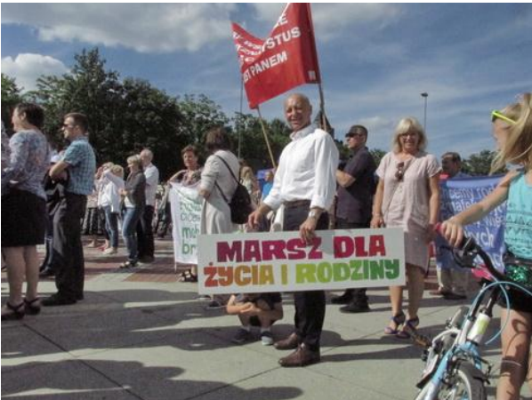
Plakat Marszu dla Jezusa, Życia i Rodziny.