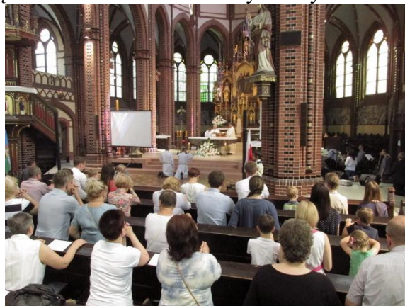
Msza św. w katedrze gliwickiej.

wią, żeby rodzice mieli kontakt z dziećmi muszą się do nich odwracać – nie wystarczy słuchać.