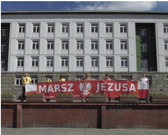
Baner Marszu na placu Krakowskim - MARSZ dla JEZUSA.