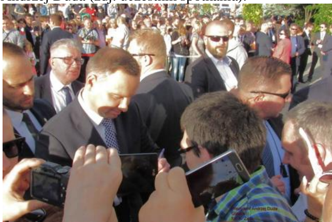
Prezydent rozdaje autografy