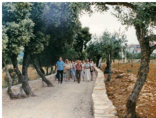
Fatima. Na Drodze Krzyżowej w 1994 r.

W 1984 roku 3-4 mln pielgrzymów i turystów odwiedziło Sanktuarium, przy czym 75 000 – 95 000 pielgrzymowało pieszo [1]. W 2000 roku do Fatimy przybyło 5-6 mln pielgrzymów i turystów, w tym 165 000 – 198 000 pielgrzymujących pieszo. Pieszo przybywali do Fatimy Portugalczycy, z których 95% podało motyw wyłącznie religijny. 77% pielgrzymów pieszych jeszcze tego samego dnia wracało do domu. W 2015 roku Sanktuarium odwiedziło 6,7 mln pielgrzymów, w tym 587 tys. w 4390 zorganizowanych grupach z 90 państw świata.