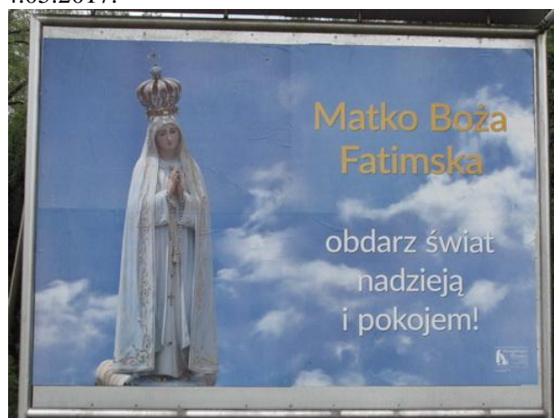
Plakat przed kościołem Narodzenia Najświętszej Maryi Panny i Świętego Walentego w Bielsku-Białej Lipniku – 7.05.2017.