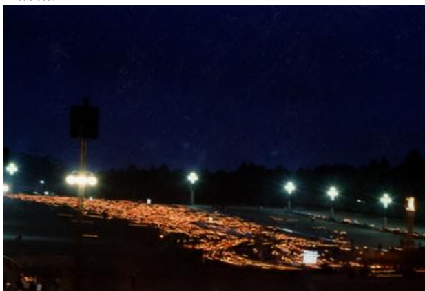
Fatima. Procesja światła w 1994 r.

tima z małej pasterskiej osady stała się ośrodkiem o znaczeniu międzynarodowym, a obsługa pielgrzymów jest głównym zajęciem mieszkańców miasta.