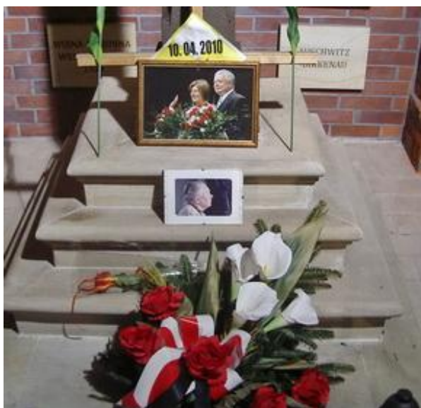
Golgota Polska przy kościele wojskowym w Gliwicach – 19 marca 2013 r.