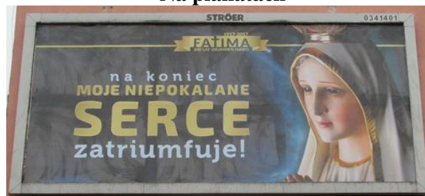
Plakat przy ul. Pszczyńskiej 71 w Gliwicach – 4.05.2017.