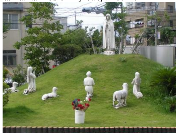
Matka Boska Fatimska oraz Łucja, Franciszek i Hiacynta. Obok katolickiej katedry Panny Marii w Osaka (Japonia).

Pielgrzymki nie są tylko specjalnością katolików [2]. Najwięcej pielgrzymów w ciągu roku, bo aż 30 milionów, odwiedza Ayyappan Saranam w Indiach (Hindu). 20 milionów chrześcijan pielgrzymuje rocznie do Matki Boskiej Guadalupe w Meksyku, 13 mln Sikhów pielgrzymuje do Złotej Świątyni w Amritsar w stanie Pendżab w Indiach. Fatima jest na 12 miejscu. Według ARC, w 2011 roku do różnych miejsc na świecie przybywało co najmniej 155 mln pielgrzymów. Katowicki KIK pielgrzymował do Fatimy w latach 1994, 2002 i 2016.