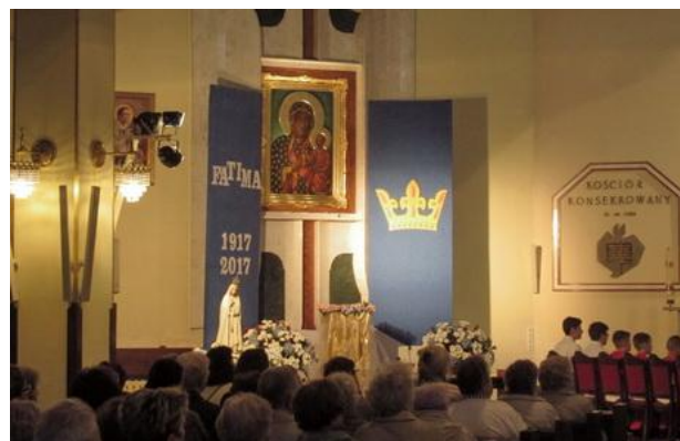
Dekoracja w kościele Najświętszego Serca Pana Jezusa w Bielsku-Białej – 13.05.2017.