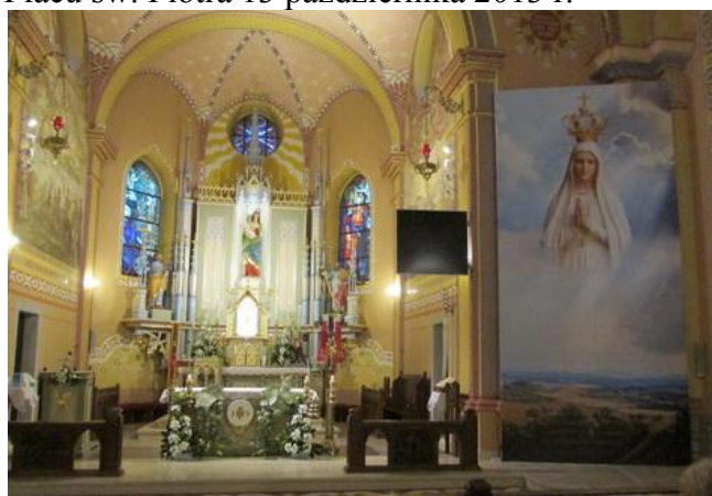
W kościele Narodzenia Najświętszej Maryi Panny i Świętego Walentego w Bielsku-Białej Lipniku – 13.05.2017.

W diecezji bielsko-żywieckiej został wydany folder z programem uroczystości z okazji 100. Rocznicy objawień w Fatimie i Aktem zawierzenia ludzkości Matce Bożej Fatimskiej wypowiedzianym przez Papieża Franciszka na zakończenie Mszy Świętej z okazji Dnia Maryjnego na Placu św. Piotra 13 października 2013 r.