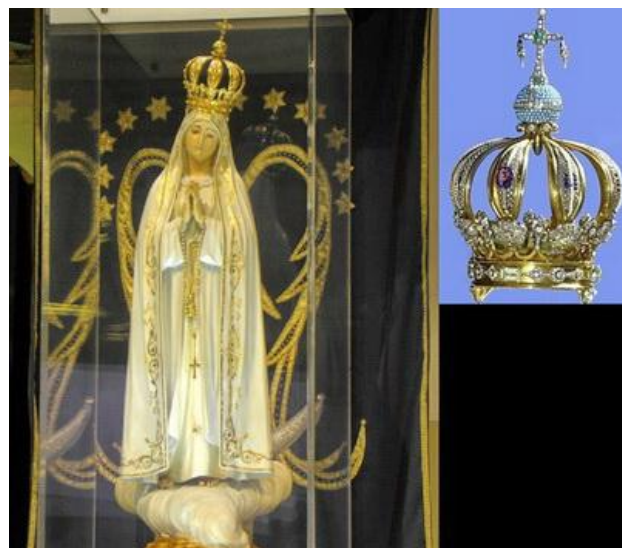
Figura Matki Boskiej w Kaplicy Objawień w Fatimie z koroną.

Koronę wykonało w Lizbonie 12 jubilerów, którzy pracowali 3 miesiące bez wynagrodzenia. Korona waży 1,2 kg. Zdobiona jest 313 perłami, 17 rubinami, 14 szmaragdami, 269 turkusami i innymi szlachetnymi kamieniami. Korona zwieńczona jest krzyżem, który został umieszczony na turkusowej kuli symbolizującej kulę ziemską. Pod kulą umieszczono jeden z pocisków wystrzelonych przez Ali Agcę w czasie zamachu na Jana Pawła II 13 maja 1981 r. Kaliber pocisku idealnie pasuje do otworu, który był pod turkusową kulą.