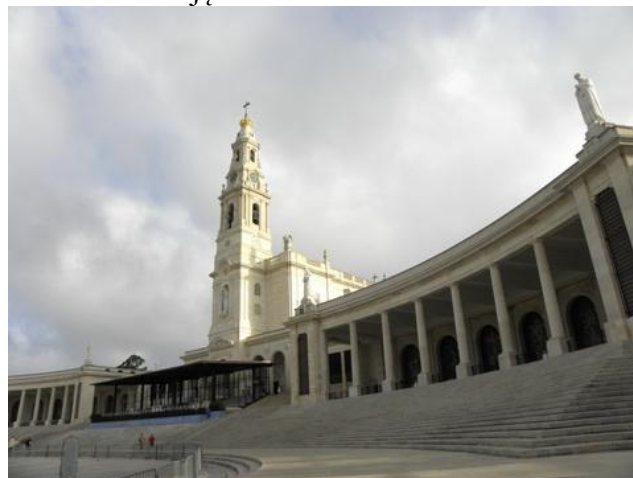
Fatima. Bazylika w 2011 r.

Wkrótce po zamachu 13 maja 1981 r., Ojciec Święty Jan Paweł II spełnił prośbę Matki Boskiej i 7 czerwca 1981 r. zawierzył ponownie nie tylko całą ludzką rodzinę Jej Niepokalanemu Sercu, ale także i Rosję.