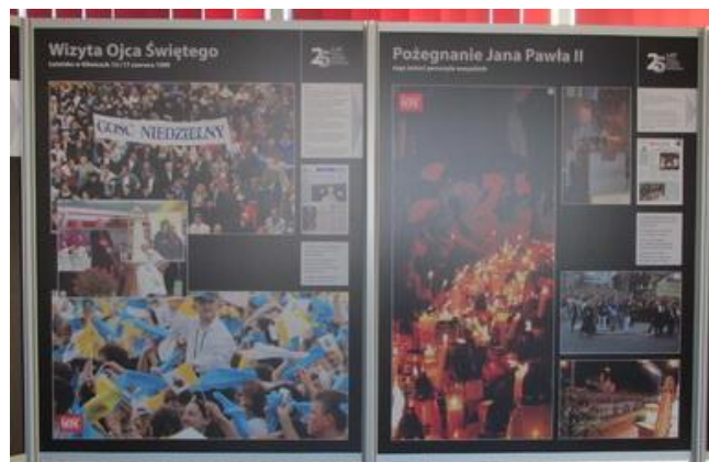
Wizyta Ojca Świętego, Pożegnanie Jana Pawła II

Więcej o wystawie zorganizowanej przez Redakcję „Gościa Gliwickiego” można przeczytać w artykule redakcyjnym pt. Ćwierć wieku z „Gościem” zamieszczonym w „Gościu Gliwickim” na str. V – dodatku do „Gościa Niedzielnego” nr 13, rok XCIV, 2 IV 2017.