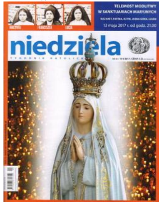
Niedziela, nr 20, 14 V 2017

Zarówno w „Gościu Niedzielnym”, jak i w „Niedzieli” jest wiele artykułów poświęconych objawieniom Matki Bożej.