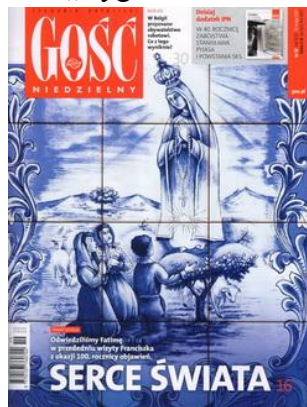
Gość Niedzielny, nr 19, rok XCIV, 14 V 2017.

Regularnie kupuję z tygodników katolickich „Gościa Niedzielnego” i „Niedzielę”, a ze świeczek „Tygodnik Solidarność” i „wSieci”.