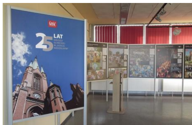
Widok na wystawę w sali ekspozycyjnej 307 na II piętrze.

Do 26 kwietnia 2017 r. można było oglądać interesującą wystawę fotografii, na której Redakcja „Gościa Gliwickiego” przedstawiła najważniejsze wydarzenia i najciekawsze miejsca związane z Kościołem gliwickim. Wystawa składa się z planszy tytułowej i 9 plansz tematycznych: Ingresy biskupów gliwickich, Pocysterskie opactwo w Rudach, Rusinowice, Nasze pielgrzymowanie, Miłosierdzie Caritas, Wizyta Ojca Świętego, Pożegnanie Jana Pawła II, Dzieła i Inicjatywy (Światowe Dni Młodzieży w Polsce 2016).