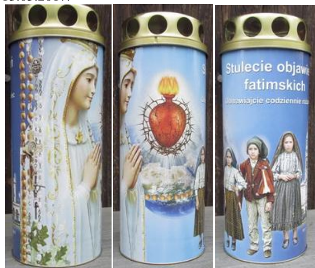
Okolicznościowy znicz na wieczorną procesję do nabycia na stoliku z czasopismami w kościele NNMP i św. Walentego w Lipniku – 13.05.2017