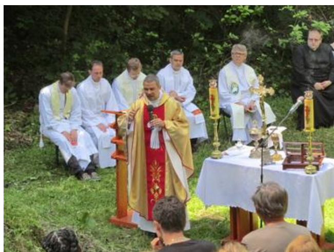
Ksiądz z Francji głosi homilię.

Czytania były w języku francuskim i zaraz potem po polsku (czytał ks. Proboszcz) [Ga 2,19-20, J 15,1-8]. Homilię wygłosił główny celebrans po francusku. Nie znając zupełnie tego języka, zwróciłem uwagę tylko na wspomnienie św. ojca Maksymiliana Kolbego.