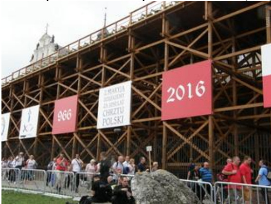
966 Z MARYJĄ DZIĘKUJEMY ZA 1050 LAT CHRZTU POLSKI 2016 (BW).