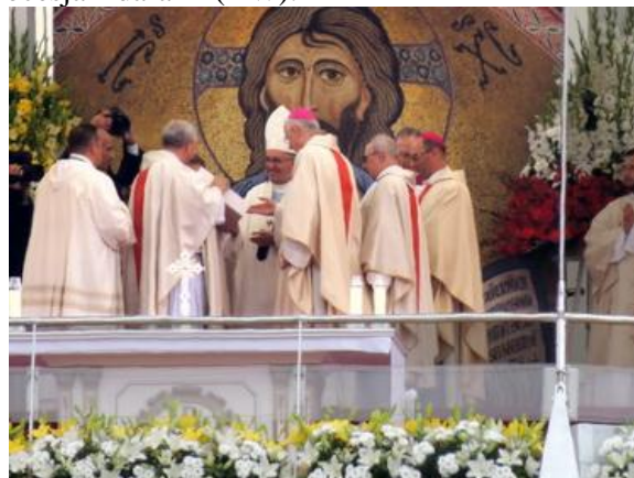
Delegacja polskich duchownych wręczyła papieżowi Franciszkowi krzyż wykonany z drewna z czasów Mieszka I.