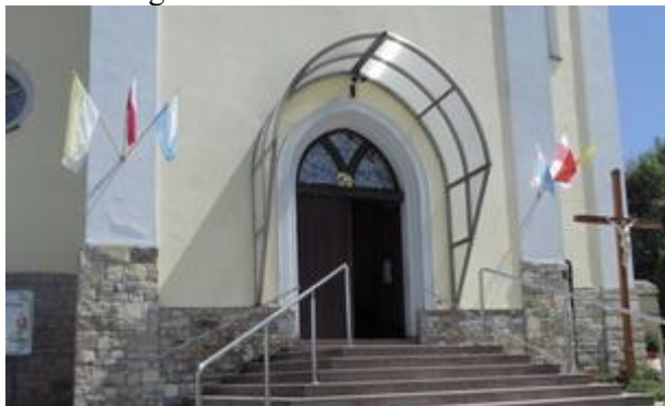
Dekoracja kościoła parafialnego w Lipniku.