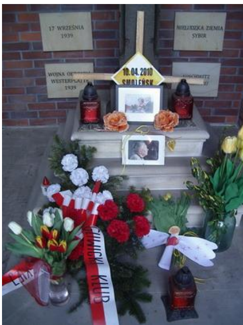
Golgota Polska w kościele garnizonowym w Gliwicach – 13 kwietnia 2012 r.