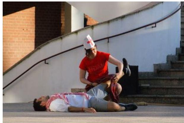
Próby na schodach naszego kościoła.