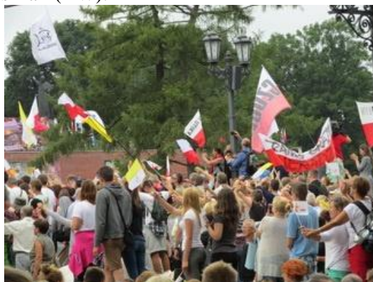
Radosne pożegnanie (SW).