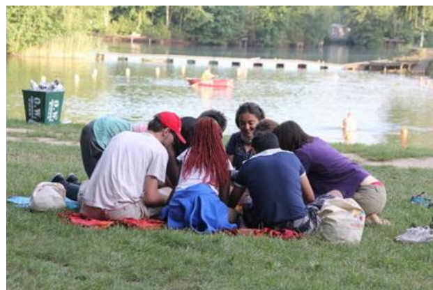
Relaks nad jeziorem.

We wstępnym planie ze względu na bariery językowe, miała to być pantomima. Jednak ogromny temperament i wspaniałe osobowości artystyczne naszych uczestników nie do końca nam na to pozwoliły! Jak się przygotowywaliśmy do naszego przedstawienia? Każdego dnia mieliśmy kilka elementów stałych: modlitwa poranna, Msza Święta i modlitwa wieczorna. Również codziennie dzieliliśmy się na małe grupki tzw. kręgi Magis, w których dzieliliśmy się doświadczeniem dnia, zarówno od strony duchowej jak i codziennych trosk i radości. Także codziennie mieliśmy warsztaty i to właśnie podczas nich planowaliśmy, ćwiczyliśmy i przygotowywaliśmy wszystkie materiały potrzebne nam do przedstawienia.