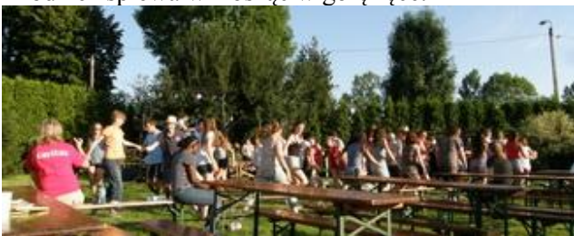
Taniec przed sceną.