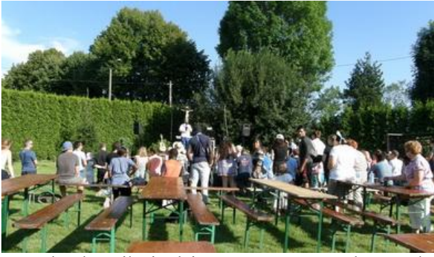
Koronka do Miłosierdzia Bożego – prowadzący młody Francuz trzyma krzyż z figurą Pana Jezusa. Częstki odmawiane są na przemian po polski i po francusku.