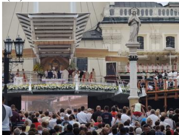
Procesja z darami (AW).

to z macierzyńską troską, ze swoją obecnością i dobrą radą, ucząc nas unikania arbitralnych decyzji i szemań w naszych wspólnotach. Jako Matka rodziny chce nas strzec razem. Wasz naród pokonał na swej drodze wiele trudnych chwil w jedność. Niech Matka, mężna u stóp krzyża i wytrwała w modlitwie z uczniami w oczekiwaniu na Ducha Świętego, zaszczerpi pragnienie wyjścia ponad krzywdy i rany przeszłości i stworzenia komunii ze wszystkimi, nigdy nie ulegając pokusie izolowania się i narzucania swej woli. (...)