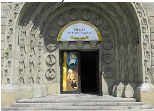
Katedra św. Mikołaja w Bielsku-Białej.