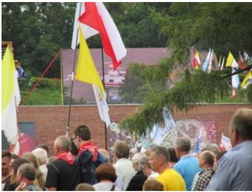
Tym helikopterem odleci Papież do Krakowa (SW).