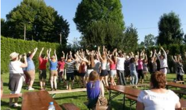
Młodzież śpiewa wznosząc w górę ręce.