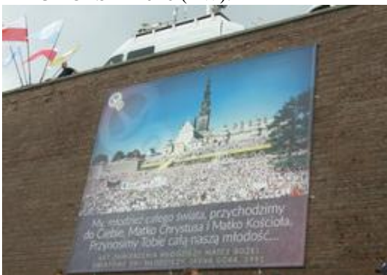
My, młodzież całego świata, przychodzimy do Ciebie, Matko Chrystusa i Matko Kościoła. Przynosimy Tobie całą naszą radość...