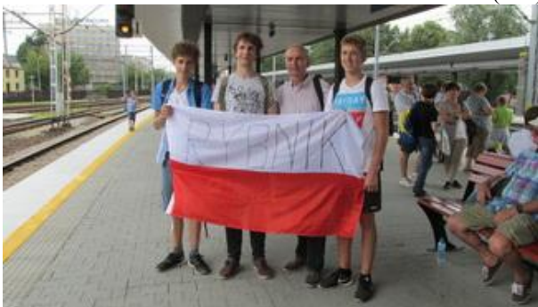
W pielgrzymce uczestniczył dziadek z wnukami – mieszkańcy Rybnika (SW).