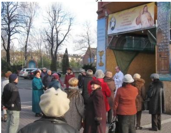
Członkowie zabrzańskiej sekcji Klubu Inteligencji Katolickiej w Katowicach przed Kościołem św. Anny w Zabrzu – siedzibą sekcji.