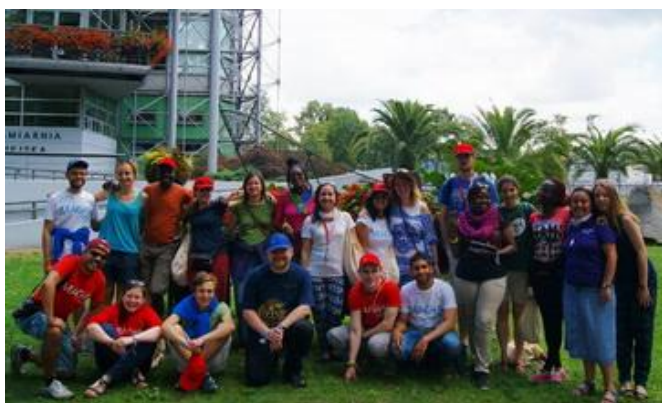
Nasi goście przed palmiarnią w Gliwicach.

Nasz Eksperyment w Gliwicach na Koperniku nosił nazwę: „Nigdy niekończąca się opowieść” i dotyczył on kategorii artystyczno-teatralnej. Naszym celem było przedstawienie teatralne dotyczące postaci św. Ignacego Loyoli.