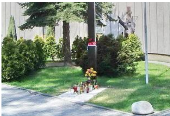
Znicze pod krzyżem przy kościele NSPJ w Bielsku-Białej - 23 IV 2010 r.