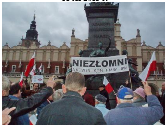
Rynek w Krakowie