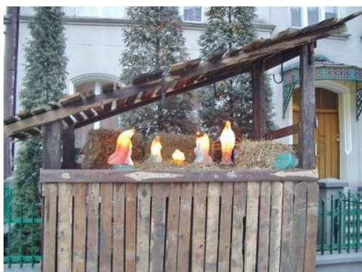
Szopka przed plebanią parafii p.w. Niepokalanego Serca Najświętszej Maryi Panny w Katowicach (4 I 2007 r.)

Podnieś rękę, Boże Dziecię, Błogosław Ojczyznę miłą, W dobrych radach, w dobrym bycie Wspieraj jej siłę swą siłą, Dom nasz i majątność całą, I wszystkie wioski z miastami. A Słowo ciałem się stało I mieszkało między nami.