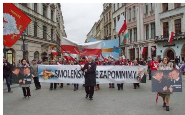
Czolo marszu w Krakowie