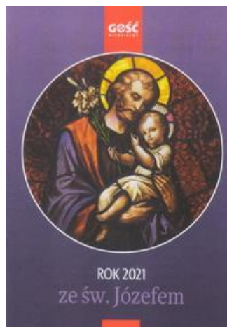
Wkładka do GN nr 1, rok XCVIII, 10 I 2021

Franciszek Kucharczak (tekst), Henryk Przon- dziono (zdjęcia): Święty Józef z pierścieniem, s. 68-73.