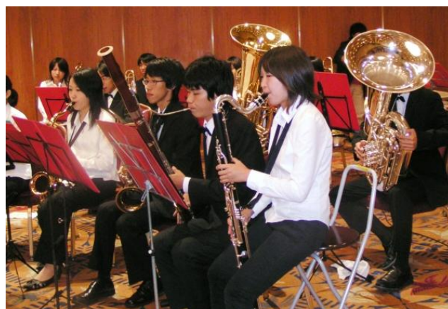
Osaka. Koncert japońskiej orkiestry wykonującej utwór „Gwizdaj podczas pracy” z filmu Disneya „Królewna Śnieżka i siedmiu krasnoludków”.