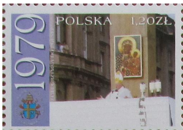
1979 POLSKA 1,20 ZŁ I PIELGRZYMKA DO POLSKI Città del Vaticano € 0,41