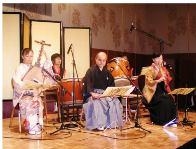
Osaka. Koncert tradycyjnej muzyki japońskiej.

Japończycy bardzo lubią muzykę, zarówno tradycyjną, jak i współczesną.