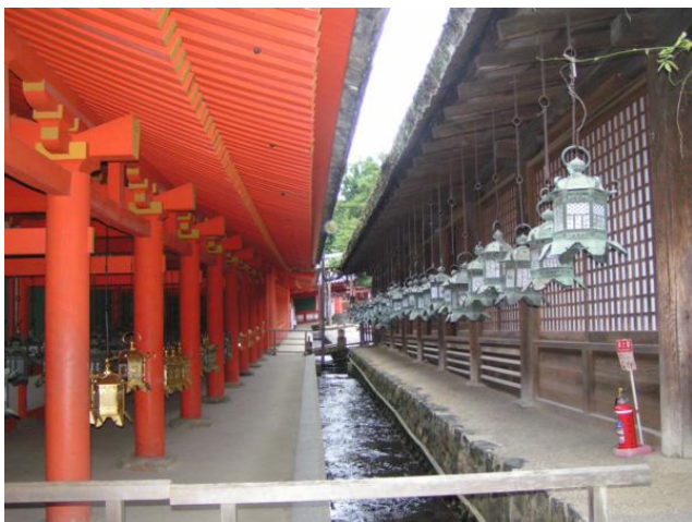
Chram szinto w Nara. Latarnie wotywne.

Szintoizm – Droga bogów jest religią rdennie japońską pochodzącą z wierzeń animistycznych