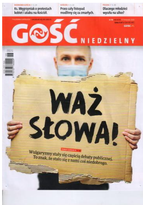
Gość Niedzielny nr 46, rok XCVII, 15 XI 2020.