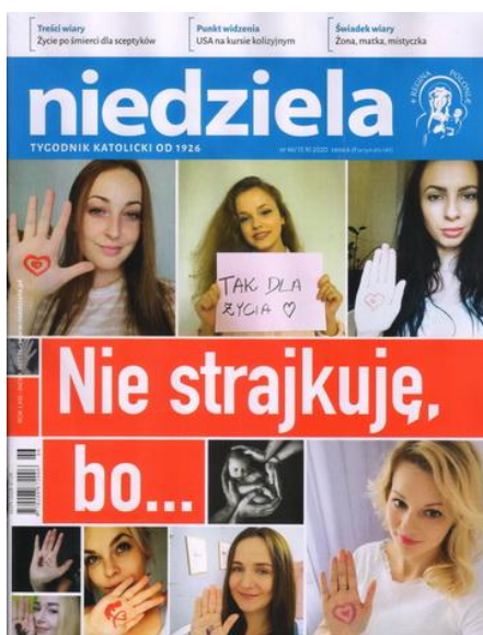
Niedziela, nr 46, 15 XI 2020.