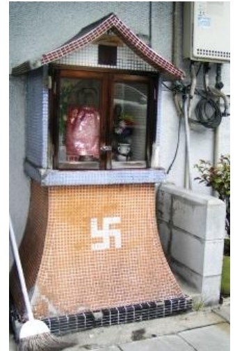
Osaka. Buddyjska kapliczka przy ulicy.

Buddyzm powstał w Indiach w V w. przed Chr., a do Japonii dotarł w 538 r. Dla wielu Japończyków charakterystyczny jest synkretyzm religijny, czemu sprzyja filozofia konfucjanizmu.