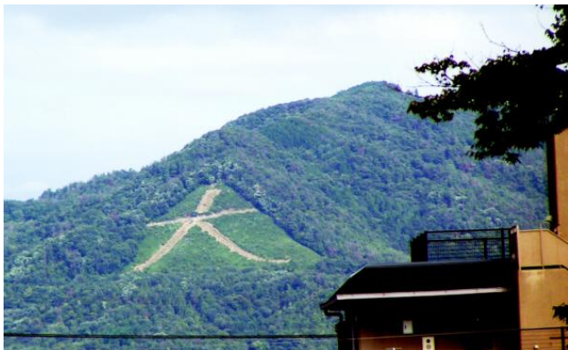
Ten znak na górze nad Kioto oznacza szczęście lub swinie.