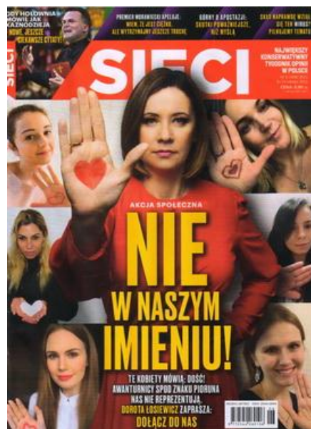
Sieci, nr 6 (428), 8-14 II 2021.

Naklejka dołączona do Gazety Polskiej nr 46 (1422), 10 XI 2020. #NieStrajkuje.