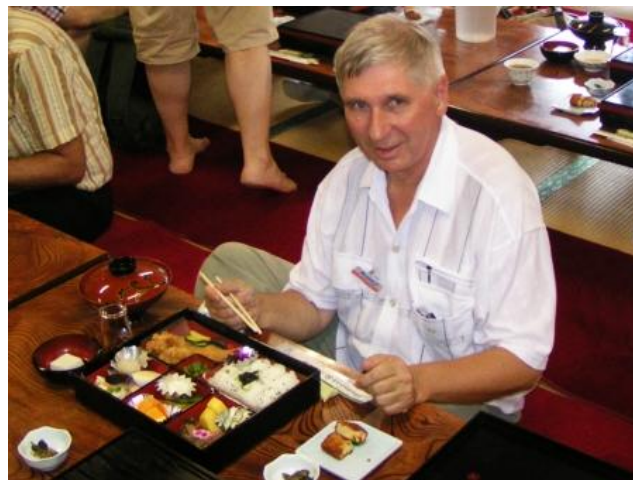
Koyasan. Lunch w japońskiej restauracji. Jemy pałeczkami, a zupę pijemy z miseczek. Stolik jest niski, wchodzimy bez butów. Jedzenie pałeczkami nie jest trudne.

Typowe dla kuchni japońskiej są potrawy z ryżu, warzyw, soji (pasta miso i tofu), świeżych ryb i owoców morza. Przed posiłkiem Japończyk mówi „Itadakimasu”, a po posiłku „Gochiso-sama deshita” (To była ucztą).