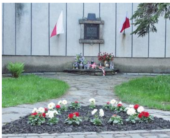
Tablica na kościele Najświętszego Serca Pana Jezusa w Bielsku-Białej – 13 V 2017.