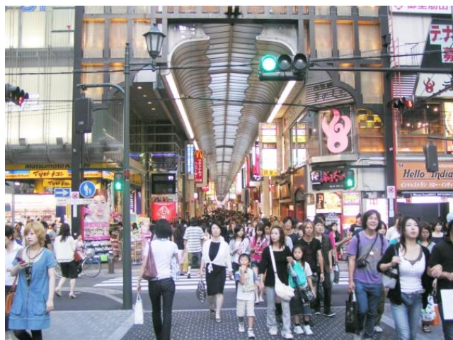
Społeczeństwo japońskie nastawione jest na konsumpcję. Zadaszona ulica w dzielnicy handlowej w Osace.