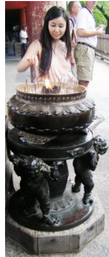
Nara. W buddyjskiej świątyni Today.

przed 2500 lat. Szintości czczą bóstwa opatrnościowe. Dogmatem było boskie pochodzenie rodziny cesarskiej. W XIX wieku shintoizm został uznany religią państwową. Od 1946 r. państwo nie wspiera żadnej religii.