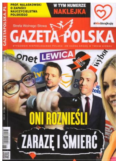
Gazeta Polska, nr 46 (1422), 10 XI 2020.

W TYM NUMERZE NAKLEJKA ONI ROZNIĘŚLI ZARAŻĘ I ŚMIERĆ Onet LEWICA TVN STRAJK KOBIET Gazeta Wyborcza Platforma Obywatelska.