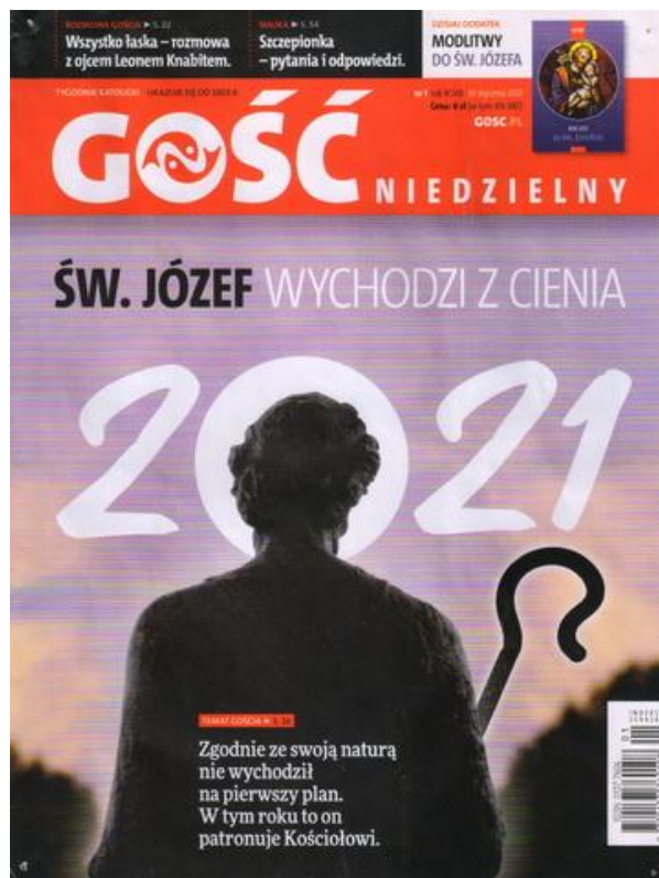
Gość Niedzielny, nr 1, rok XCVIII, 10 I 2021, s. 1.

Andrzej Macura, Gość Niedzielny, nr 6, rok XCVIII, 14 II 2021, s. 7