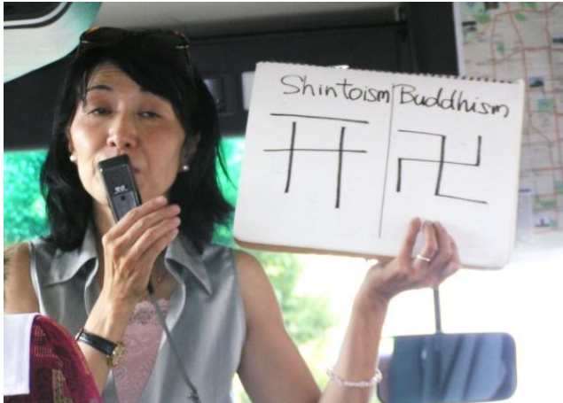
Przewodniczka pokazuje nam, jak rozróżnić świątynię szintoistyczną (chram) od buddyjskiej.

W Japonii rozwinęła się sztuka kaligrafii.