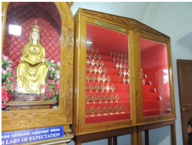
Matka Boża Oczekująca (Brzemienna) i relikwie świętych

Przy drodze prowadzącej do Sanktuarium jest 15 stacji drogi krzyżowej.