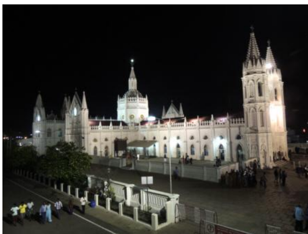
Velankanni, stan Tamil Nadu. Bazylika Matki Bożej Dobrego Zdrowia jest w odległości 100 m od plaży.

Chrześcijaństwo zaszczerpione przez św. Tomasza Apostoła w Indiach przetrwało do dziś i dalej się rozwija.