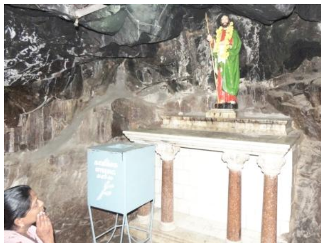
Grotta św. Tomasza na Małej Górze.

Obok bazyliki jest grób św. Tomasza, ale pusty, bo jego ciało przeniesiono w IV w. do Edessy w Azji Mniejszej.