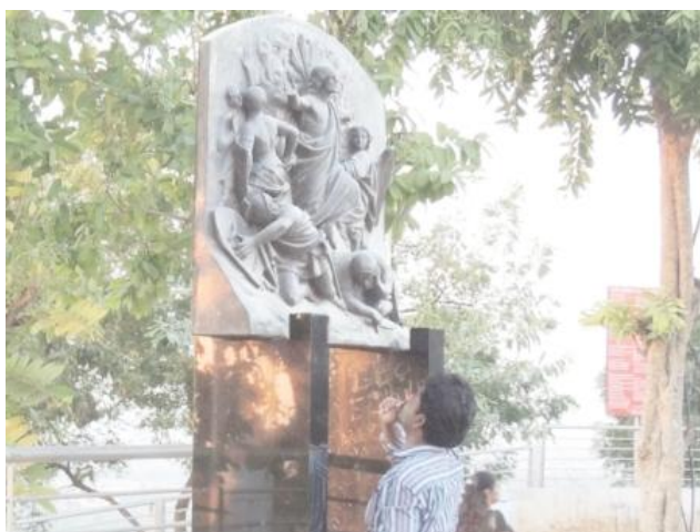
Ćennaj. Góra św. Tomasza. Stacja 15. Zmartwychwstanie.

Przy drodze prowadzącej do Sanktuarium jest 15 stacji drogi krzyżowej.