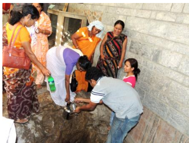
Źródło św. Tomasza Ap.

Na Małej Górze jest grotta, gdzie mieszkał św. Tomasz oraz cudowne źródło, które wypłynęło, gdy uderzył laską w skałę.