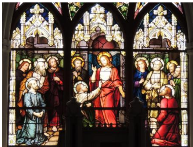
Witraż z bazyliki św. Tomasza Ap. „Pan mój i Bóg mój”.

Neogotycką bazylikę św. Tomasza Ap. w Santhome – dzielnicy Ćennaj (stan Tamil Nadu) nad Zatoką Bengalską – zbudowano nad grobem św. Tomasza w 1898 r. W bocznej kaplicy jest cudowna figura Matki Bożej z Mylapore. W 1545 r. św. Franciszek Ksawery 4 miesiące przebywał w Santhome. Spędził nocę na modlitwie w pobliżu grobowca św. Tomasza, gdzie wtedy stała cudowna figura Maryi. Błagał Matkę Bożą o ochronę przed piekielnymi duchami, o których mówiono, że molestowały go, aby zrezygnował z podróży na Daleki Wschód.