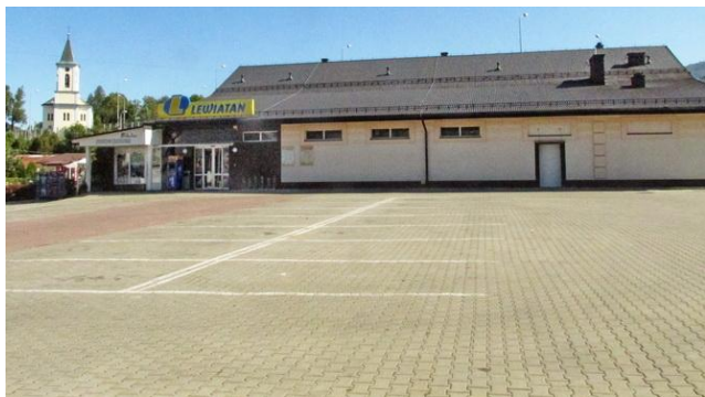
Bogu dzięki za niedziele wolne od handlu – parking przed domem towarowym „Lewiatan” w centrum Lipnika, dzielnicy Bielska-Białej – 22 IX 2019 r..