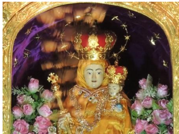
Figura Matki Bożej w oltarzu w bazylice w Velankanni.

12-metrowa fala tsunami dotarła do bazyliki rano 26 XII 2004 r., gdy na mszy św. było 2000 osób i rozdzieliła się przed bazyliką i zatapiając część miasta. Zginęło 1000 osób. Ocalenie ludzi w bazylice bp Devadass Ambrose uznał za cud.