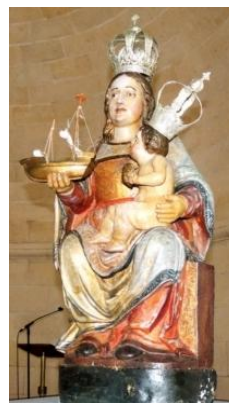
Cala d'Or. Matka Boża Morza (Santa Maria del Mar).

Z Majorki pochodzą: św. Junípero Serra (1713-1784) założyciel 9 misji franciszkańskich w Kalifornii oraz 5 błogosławionych. Koło Manacor są pozostałości bazyliki chrześcijańskiej św. Piotra z V w. zniszczonej przez muzułmanów. Zachowały się mozaiki i baptysterium.