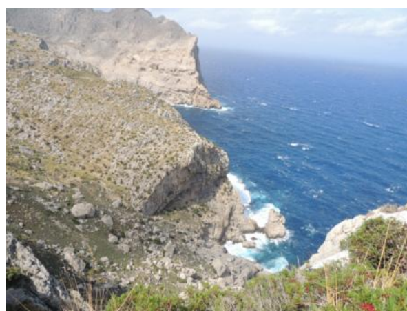
Widok z punktu widokowego El Colomer na półwyspie Formentor.

Zachodnią część wyspy zajmują góry Serra de Tramuntana, w niektórych partiach przypominające Tatry, chociaż sięgają tylko do 1455 m n.p.m. Góry te wychodzą prosto z morza.