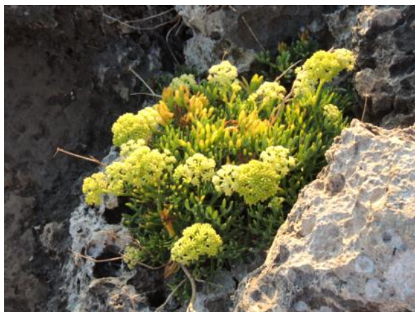
Sukulenty wykorzystują wgłębienia w wapiennych skałach