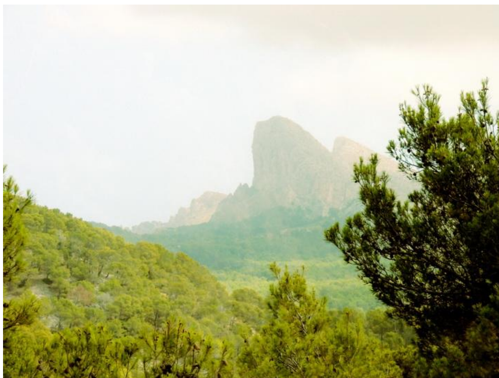
W górach Serra de Tramuntana