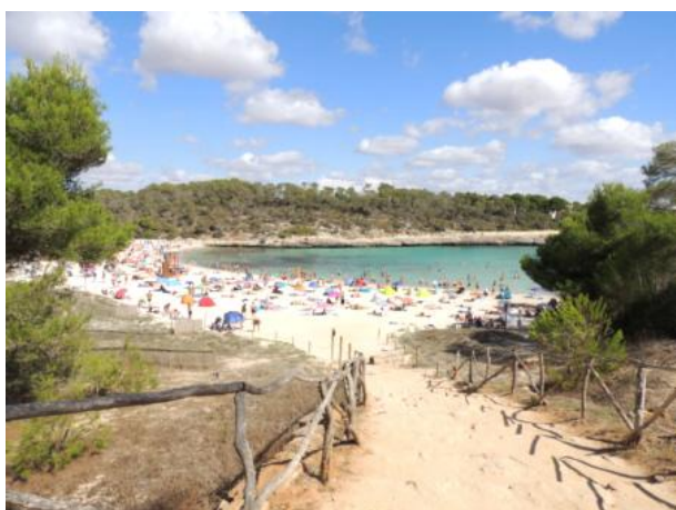
Plaża S'Amarador w Parku Przyrody Mondrago.

Majorka kojarzy się najczęściej z plażami. Szczególnie we wschodniej części wyspy jest wiele uroczych zatoczek zwanych cala i pięknych plaż. Kiedyś osady były narażone na ataki piratów, dlatego lokowano osady kilka kilometrów od brzegu, a przy morzu znajdował się port.