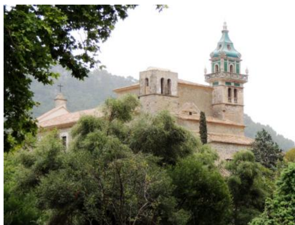
Dawny klasztor kartuzów w miejscowości Valldemossa. Obecnie muzeum.

W Valldemossie urodziła się św. Catalina Thomas. Tu, w byłym klasztorze, Fryderyk Chopin wraz z George Sand (była prawnuczką Mauricego Saskiego, nieślubnego syna Augusta II Mocnego) spędził zimę 1838/1839 r. W sali koncertowej wysłuchaliśmy utworów Chopina skomponowanych na Majorce.