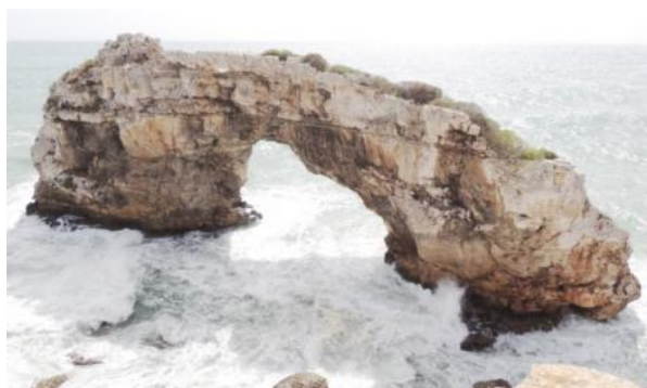
Atrakcją wschodniego wybrzeża jest skalny most Es Pontes