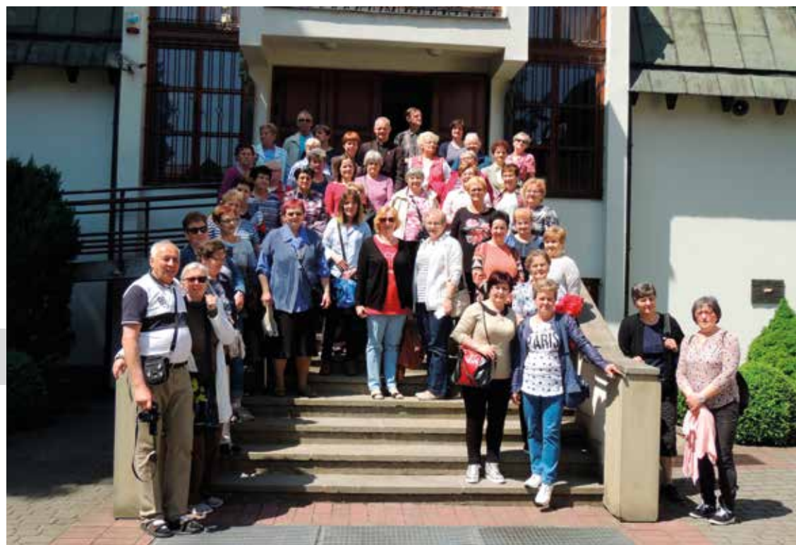
Przed grobem bł. Jerzego Popiełuszki. Żolibórz, Warszawa. Sanktuarium Ecce Homo św. Brata Alberta, Kraków. 2017 r.