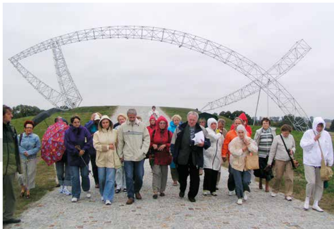
Przed Pomnikiem Poległych Stoczniovców 1970, Gdańsk. 2007 r. Brama Ryba, Brama Trzeciego Tysiąclecia na Polach Lednickich. 2008 r.