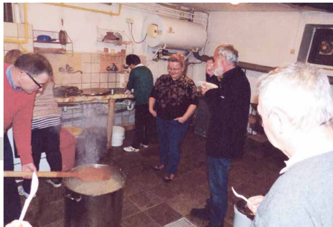
Przygotowanie Wigilii dla osób ubogich. Dom katechetyczny parafii św. Anny w Katowicach-Janowie. 2015 r.