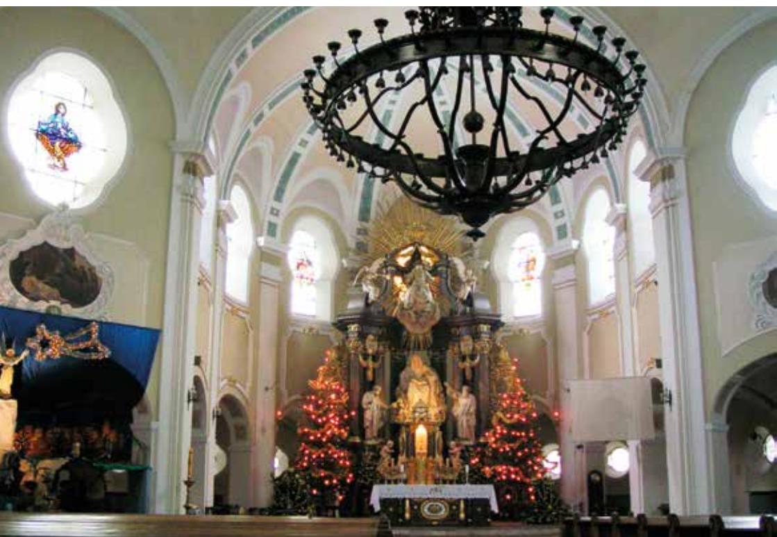
Kościół św. Anny w Katowicach-Janowie. 2019 r. Ołtarz w kościele św. Anny w Katowicach-Janowie. 2006 r.