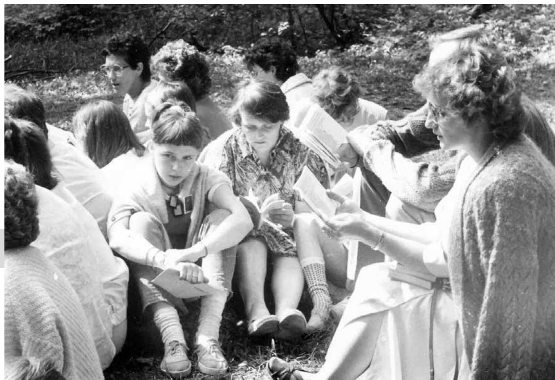
Pielgrzymka do Sanktuarium Matki Bożej Szkaplerznej w Czernej. 1989 r.