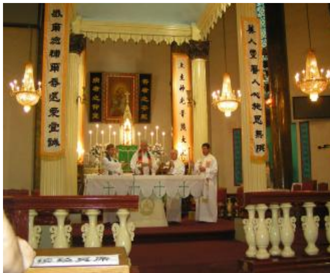
Pekin (Chiny) - Msza św. w kościele p.w. św. Józefa 2006

W średniowieczu pielgrzymi podlegali szczególnej opiece i ochronie. Napaść na pielgrzymka zagrożona była ekskomuniką. Obecnie szacuje się, że do głównych miejsc pielgrzymkowych na całym świecie przybywa rocznie ok. 300 mln. osób.