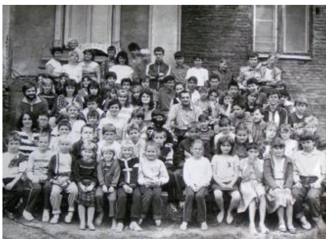
Kolonie charytatywne. Krasieczyn 1989.

Biskupiemu Komitetu Pomocy Osobom Uwięzionym i Internowanym (powołanym 17.03.1982 r.) przemianowanym 1.12.1983 na Biskupi Komitet Pomocy "Miłość i Sprawiedliwość Społeczna". Komitet działał do 17.03.1989 r. Opiniowaliśmy wnioski o stypendia fundowane przez warszawski KIK. Nasi członkowie pomagają również swoją wiedzą i doświadczeniem osobom w trudnej sytuacji oraz dzieciom w nauce.