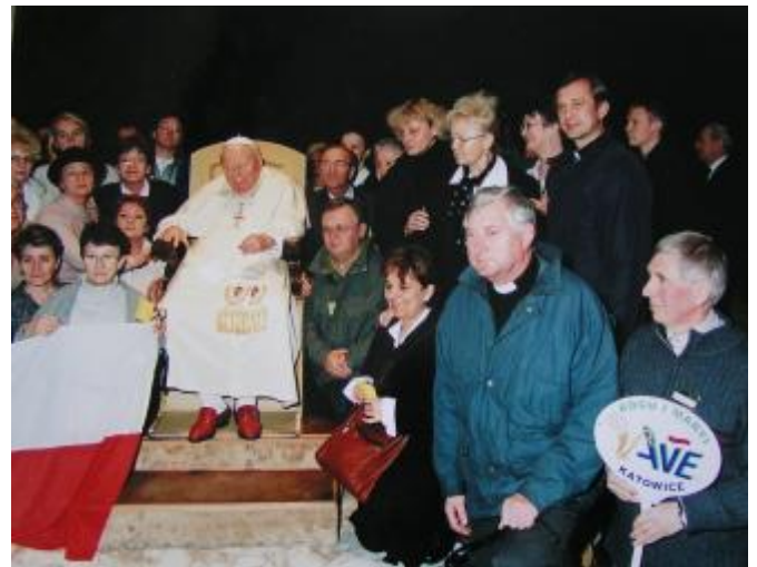
Spotkanie z Ojcem Świętym Janem Pawłem II - Watykan 1997

Wydaje się, że ruch Klubów Inteligencji Katolickiej ma i dzisiaj do odegrania ważną misję na niektórych zwłaszcza obszarach chrześcijańskiej i obywatelskiej aktywności. Pragnę wspomnieć tylko niektóre: uczenie własnym przykładem uczestnictwa w życiu publicznym pojmowanego przede wszystkim jako służba człowiekowi; ukazywanie działalności politycznej, rozumianej jako chrześcijański obowiązek i troska o dobro wspólne, bez szukania osobistych korzyści. Ważne jest również kształtowanie umiejętnej publicznej obrony wartości chrześcijańskich w życiu społecznym. Doświadczenia, jakie ruch Klubów Inteligencji Katolickiej już posiada, mogą oka-