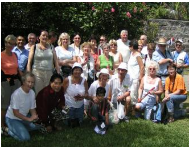
Santiago de Atitlan - Gwatemala. 2006