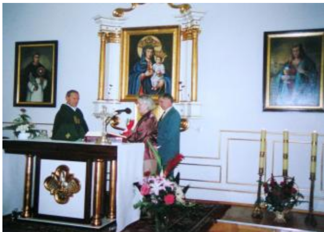
Rekolekcje KIK w Kokoszykach. 2000

Nasza działalność opiera się na nauce Kościoła Katolickiego i ma na celu kształtowanie osobowości ludzkiej i wychowanie człowieka, świadomego swych obowiązków patriotycznych, osobistych i społecznych. Większość naszych spotkań ma charakter otwarty, przez co nasze oddziaływanie nie ogranicza się tylko do członków Klubu. Organizujemy prelekcje, spotkania panelowe i dyskusyjne, bierzemy udział w rekolekcjach, pielgrzymkach, dniach skupienia, adoracjach Najświętszego Sakramentu i Mszach św., również tych za Ojczyznę i z okazji świąt państwowych. Cykliczne są rekolekcje wielkopostne u OO Jezuitów w Czechowicach, jesienne w Brennej (wcześniej w Kokoszykach), wielkopostne dla inteligencji w kościele garnizonowym św. Kazimierza w Katowicach i tamże Adwentowy Dzień Skupienia.