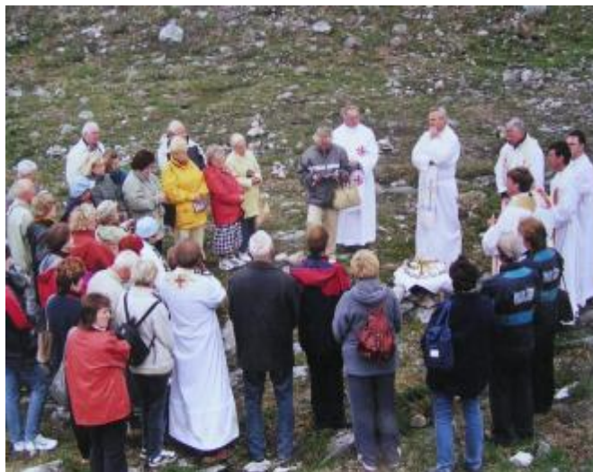
Msza św. na Kręgu Polarnym - Norwegia 2002

Pielgrzymowanie nierozłącznie związane jest z religią, z potrzebą przybliżenia się do sacrum. Pielgrzymowano już w starożytności - Herodot wspomina o 700 000 pielgrzymach w Egipcie a Juliusz Flawiusz o 2 700 000 pielgrzymach w Jerozolimie w czasie święta Paschy (historycy twierdzą, że bardzo przesadził podając tę liczbę). Od dawna chrześcijanie pielgrzymowali do Ziemi Świętej, potem do miejsc związanych z kultem Męki Pańskiej, świętych, męczenników, relikwii oraz kultem maryjnym.