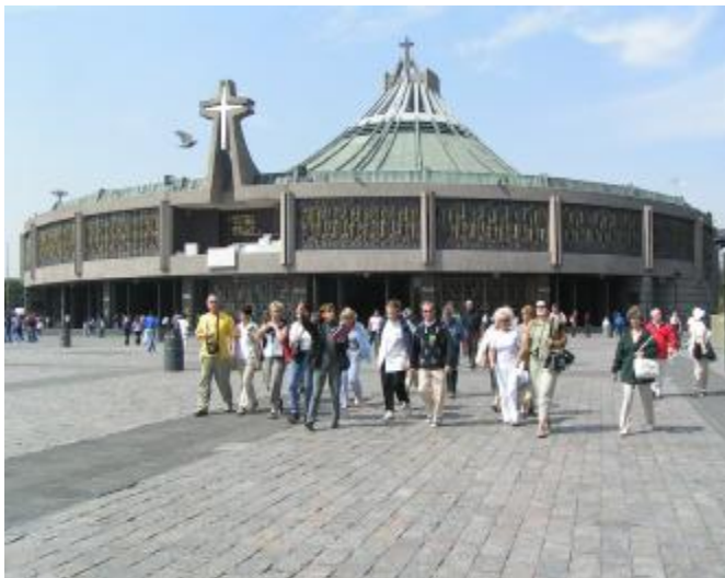
Guadalupe (Meksyk). 2006

Do wielu miejsc wracamy, czasem po latach. Odwiedziliśmy sanktuaria i miejsca ważne dla chrześcijaństwa w 42 kraje w Europie, Azji, Ameryce Północnej i Afryce. Uczestniczyliśmy w audiencjach u Ojca Świętego Jana Pawła II i Benedykta XVI. Byliśmy także obecni podczas pielgrzymek papieskich w Polsce, Czechach i na Ukrainie.