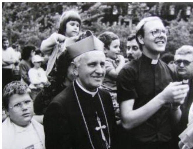
Spotkanie ks. Arcybiskupa Damian Zimonia z dziećmi w ogrodach kurialnych - 1 czerwca 1997

Do cyklicznych imprez organizowanych lub współorganizowanych od wielu lat przez nasz Klub należą Dni Kultury Chrześcijańskiej, koncerty organowe w katowickiej katedrze i Dzień Dziecka w Ogrodach Kurii Biskupiej w Katowicach.