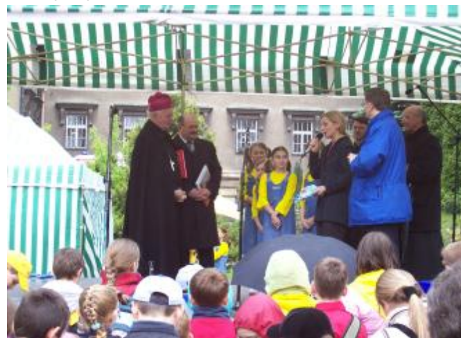
Dzień Dziecka. 2006