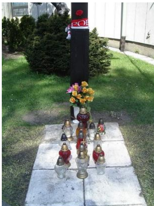
Kościół Najświętszego Serca Pana Jezusa w Bielsku-Białej - 23 IV 2010 r.