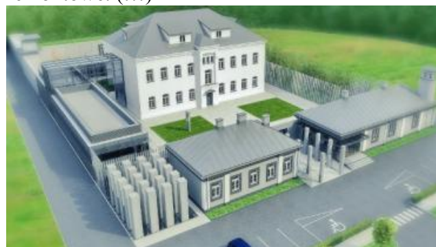
Makieta muzeum w Ostrołęce