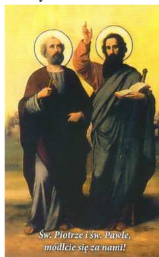
Św. Piotrze i św. Pawle, módlcie się za nami!