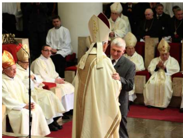
Antoni Winiarski składa życzenia i gratulacje metropolicie katowickiemu abp. Wiktorowi Skworcowi.

Po błogosławieństwie i zakończeniu liturgii abp Wiktor Skworec przyjmował gratulacje i życzenia od różnych grup i osób prywatnych.