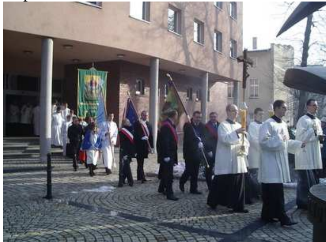
Procesja wyrusza z Centrum Jana Pawła II.