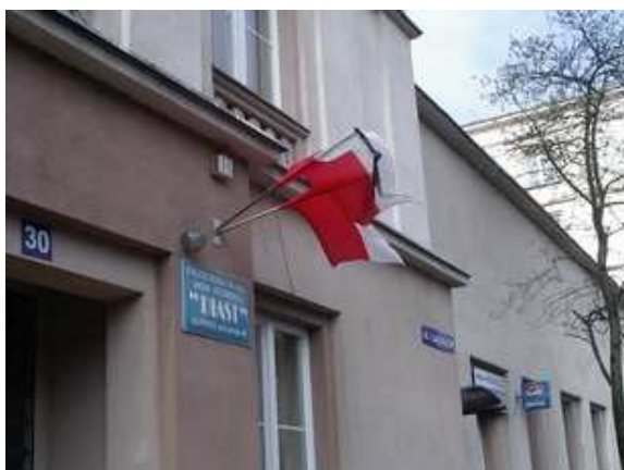
Dom Studencki Piast – przy ul. Łużyckiej w Gliwicach - 12 IV 2010 r.