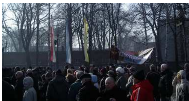
Droga Neokatechumenalna z Bytomia.