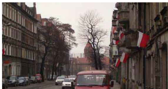
Ulica Częstochowska w Gliwicach – kwiecień 2010 r.