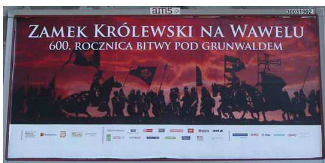
Plakat na jednym z budynków w Gliwicach – 12 VII 2010

Drodzy pielgrzymi polscy! Dzisiaj w liturgii wspominamy świętego Benedykta, jednego z patronów Europy. Jego dewiza: ora et labora jest trafną odpowiedzią na pytanie, które słyszymy podczas dzisiejszej Mszy świętej: «Nauczycielu, co mam czynić, aby osiągnąć życie wieczne?» (Łk 10, 25). Niech nasza praca i modlitwa prowadzą nas ku radosnemu spotkaniu z Bogiem, który będzie naszą nagrodą w wieczności. Serdecznie was pozdrawiam i życzę dobrego niedzielnego odpoczynku”. http://www.radiovaticana.org/pol