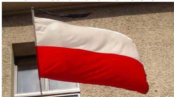
Flaga na budynku Kurii Diecezjalnej Gliwicach

Prezydent RP Lech Kaczyński i Jego małżonka Maria Kaczyńska