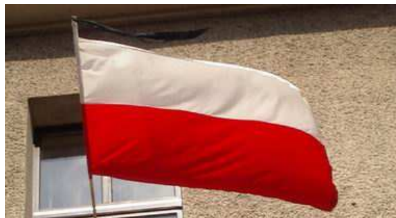
Flaga na budynku Kurii Diecezjalnej Gliwicach