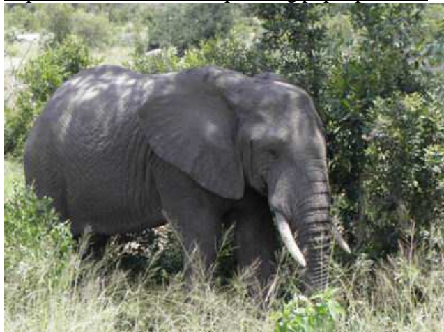
Słoń w Parku Krugera

Fotoreportaż z pielgrzymki jest na stronie: http://www.kik.katowice.opoka.org.pl/pierpa1.html