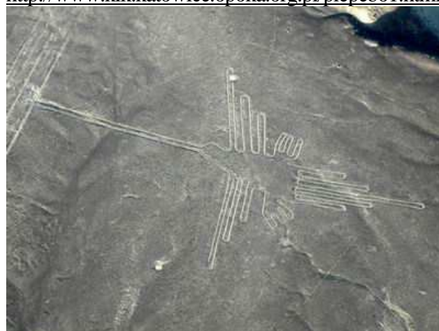
Koliber - jeden z wielu geoglifów na pustyni Nazca w Peru.

http://www.kik.katowice.opoka.org.pl/piepebo1.html