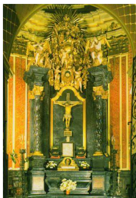
Przemyśl, Bazylika Archikatedralna – ołtarz w kaplicy Fredrów.